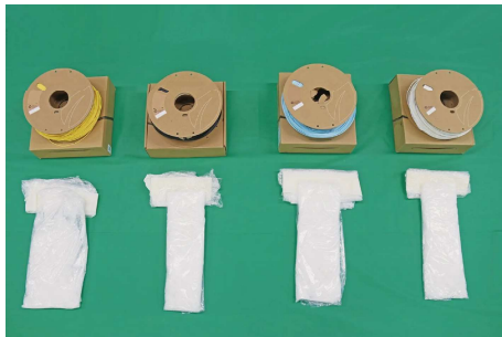
押収された覚せい剤。3Dプリンターに使用する素材に紛

アパートの空室を狙った覚醒剤・違法薬物の密輸が横行している。置き配や空室に侵入し入居者を装う手口で荷物を受け取る。今回、賃貸仲介会社社員が事業者間サイトから密輸組織に空室の情報を流出させた事件も発生した。