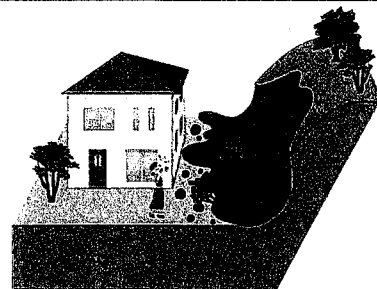
防災上の観点から適正な管理が求められる土地の例(イメージ)